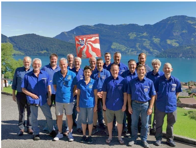
Uerner Kantonalschützenfest im Juni