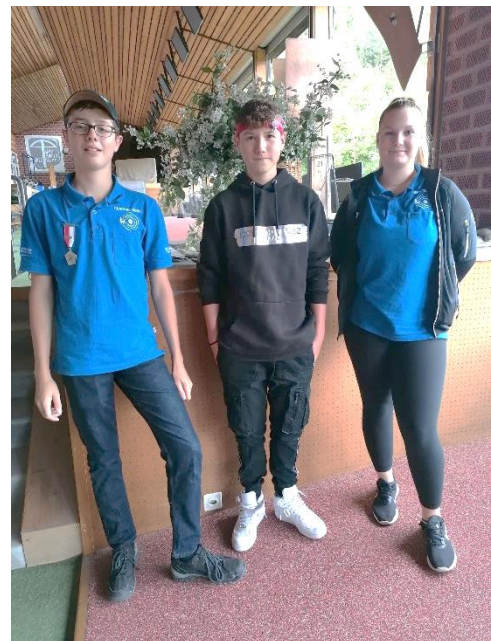
Erfolgreicher Nachwuchs am Kant. Final in Sissach

Der Vorstand wünscht Allen ein gutes und gesundes neues Jahr 2023.