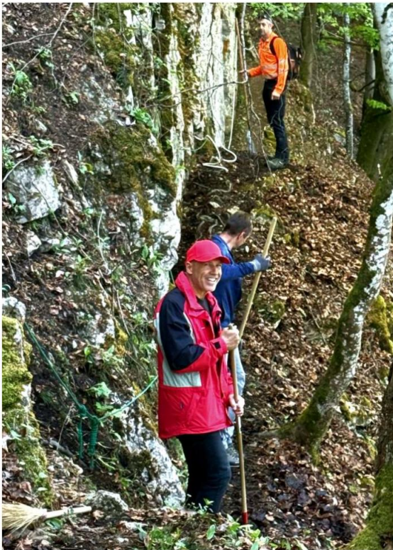
(ein Teil vom Seil wird ersetzt)

Die 1. Gruppe war am Bannwegli auf den Rehag an der Arbeit. Hier musste der Weg vom Laub gesäubert werden. Ebenfalls wurde für den bevorstehenden Banntag ein Teil der fix installierten Seile ersetzt. Zudem mussten einzelne Tritte im steilen Gelände ausgebessert oder erneuert werden. Wie jedes Jahr wurde zudem das Panzertürmli «ausgemistet». Zum Schluss hisste diese Gruppe auf dem Panzertürmli auch die Bämbelerfahne.