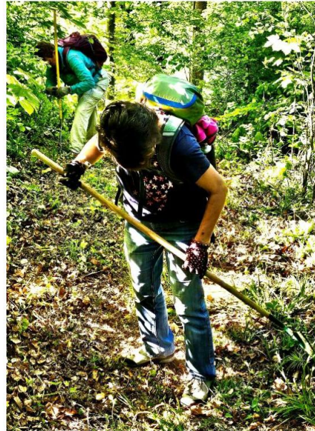
(mit Laubrechen am GEO-Lehrpfad)

Die 3. Gruppe machte sich am GEO-Lehrpfad von der Waldhütte Richtung Birchhöchi an die Arbeit. Auch hier musste mit dem Freischneider das Wegli ausgelichtet werden. Dann kamen die Gartenscheren fürs Zurückschneiden der Äste zum Einsatz. Die Laubrechen erledigten dann das Restliche.