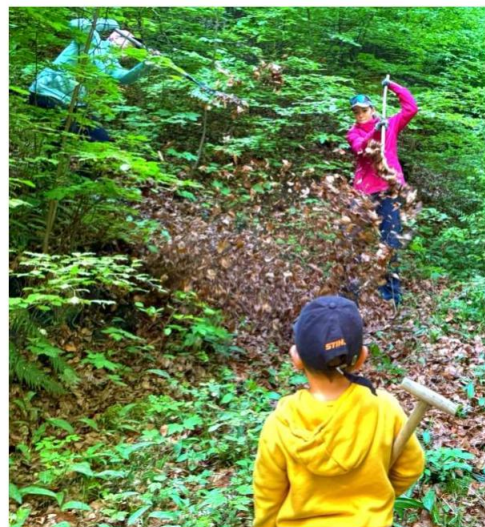
(Kinder im vollen Einsatz)

Die 4. Gruppe säuberte mit Laubrechen, Hacke und Gartenschere das „Zickzack-Wegli“ (Wanderweg vom Eschtal auf den Hornenberg). Hier konnten vor allem auch die Kinder tatkräftig mithelfen.